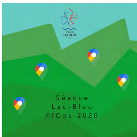
Jeu de piste à distance.

Un succès? Pourquoi ne pas le renouveler? Cette fois, pas question de faire une simple séance sur des jeux en ligne, on allait organiser la séance nous-mêmes. Mais qu'organiser, et comment? Bonne question. Il fallait imaginer un jeu typi-