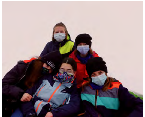
Quelques participantes dans le froid, mais heureuses.