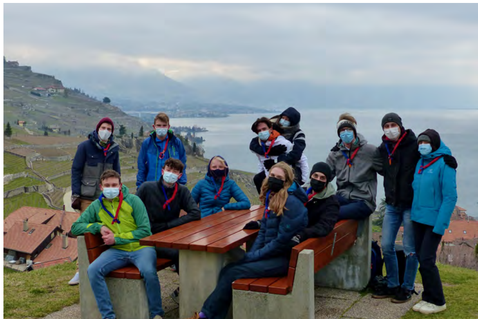
La Maîtrise en vadrouille dans le Lavaux.