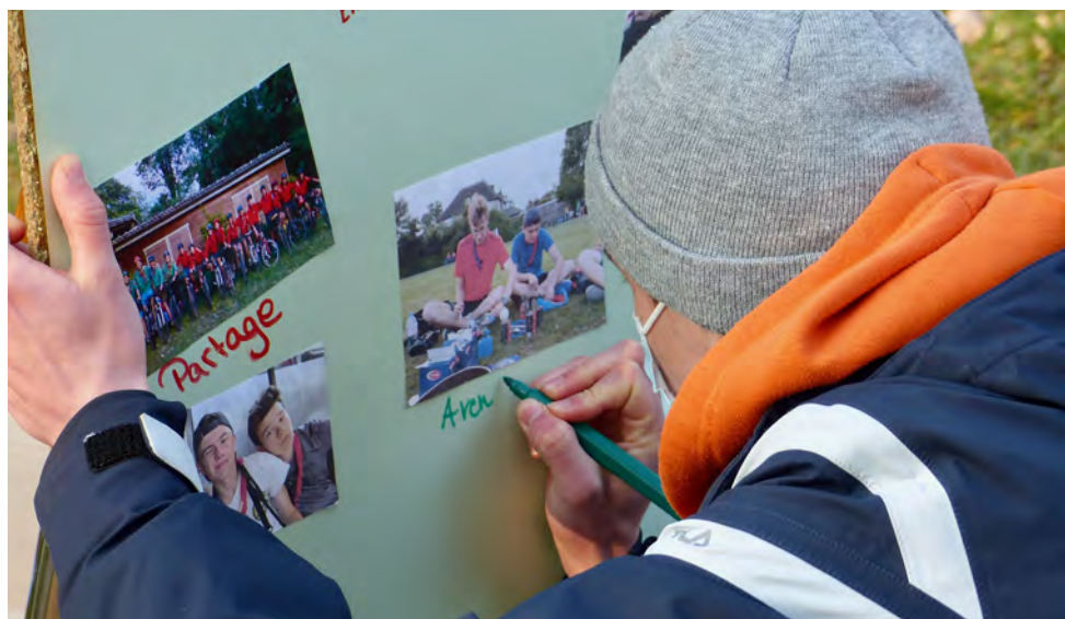
Loccasion de revenir sur les moments de partage.