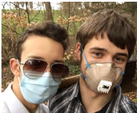
Deux acteurs du court-métrage.

quement scout comme... un jeu de piste! Quoi de plus emblématique que ces jeux de piste où les énigmes nous attendent à chaque poste? Assez naturellement, l'idée d'utiliser l'outil de navigation Google Maps nous est venue, pour ainsi créer quelque chose de semblable en ligne! À coup de postes et d'énigmes, toute une organisation nous a été nécessaire pour vivre cette expérience, qui nous a bien amusés!