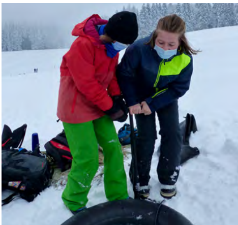
Le gonflage... étape obligatoire!