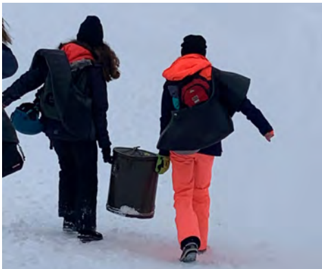
La lourde boille à thé.