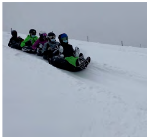
Une chaîne à 1, 2, 3, 4, 5.