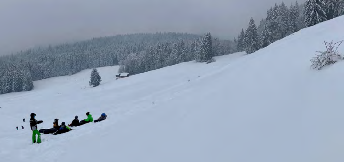
Neige à perte de vue pour une journée incroyable !